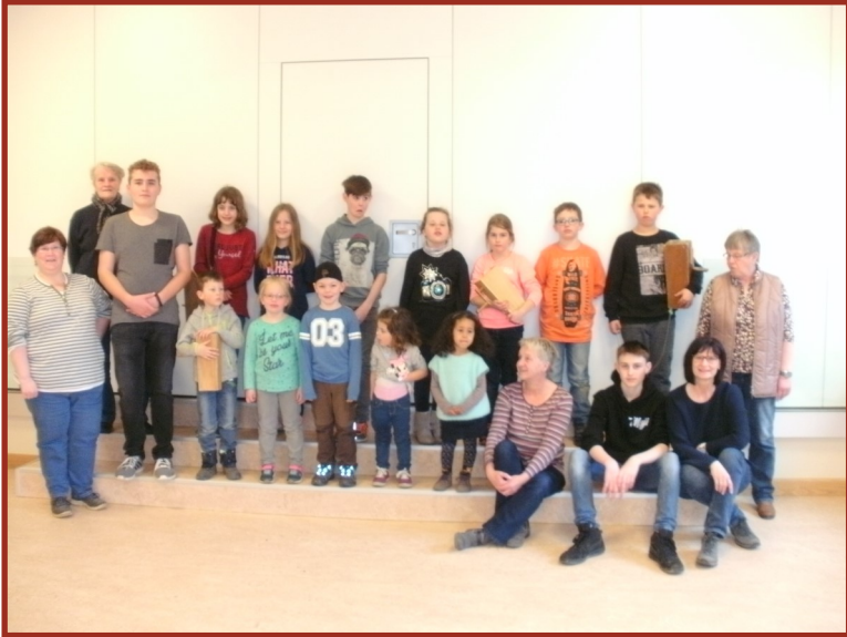
Das Foto zeigt unsere Dorfgärtner und Klepperkinder nach der Backaktion am Karsamstag