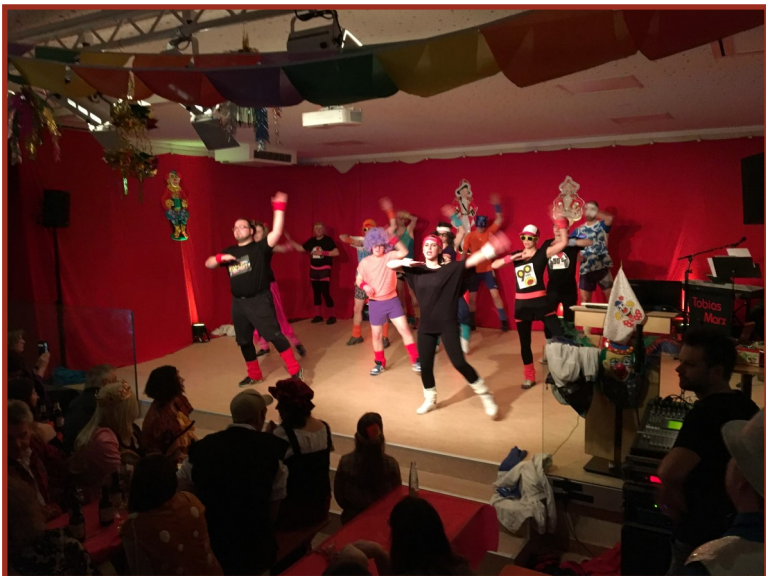
Das Foto zeigt unsere Feuerwehr beim Showtanz