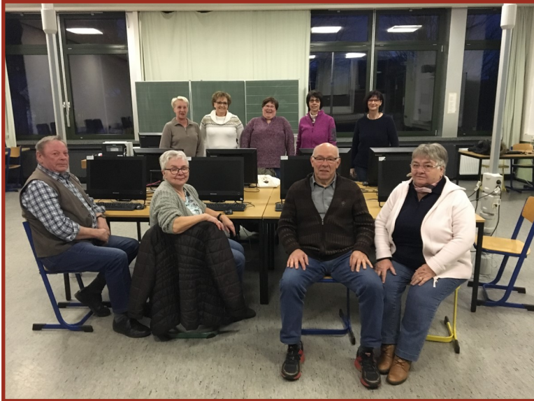
Das Foto zeigt die Teilnehmer des ersten EDV-Kurses im Computerraum der Realschule Plus in Gillenfeld