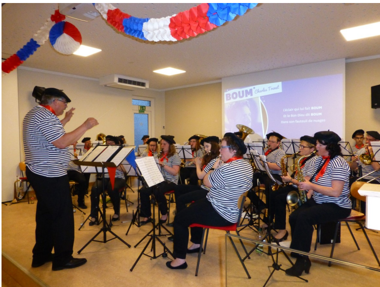
Das Foto zeigt unsere Musiker beim Vorabaufrtritt am Familienabend