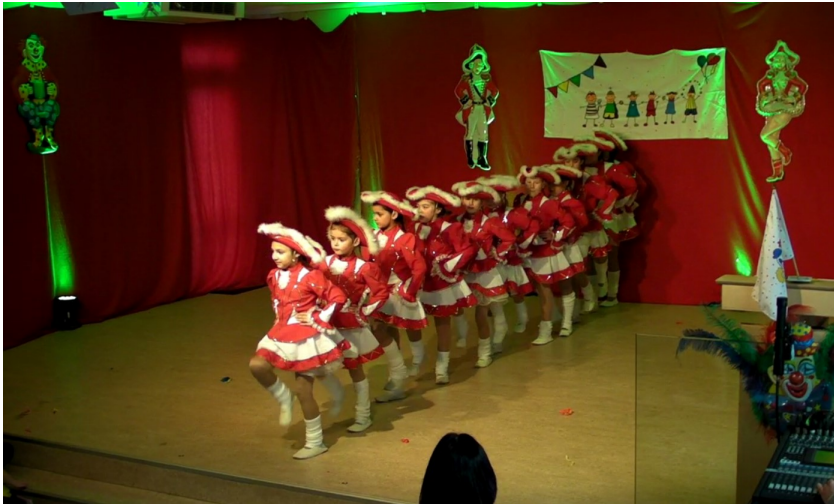
Das Foto zeigt die kleine Prinzengarde am Kinderkarneval im Bürgerhaus