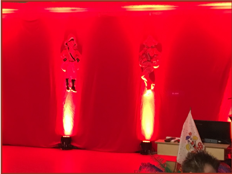
Das Foto zeigt die Bühne am Bunten Abend—verziert mit einem roten Vorhang und tollen LED-Lichteffekten